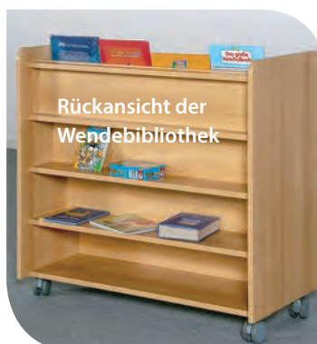
Rückansicht der Wendebibliothek