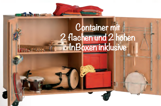
Container mit 2 flachen und 2 hohen InBoxen inklusive