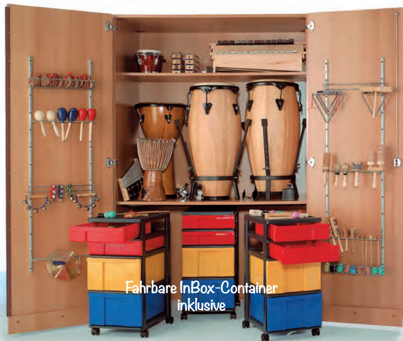
Fahrbare InBox-Container inklusive

Musikinstrumente bitte separat bestellen – siehe S. 293-294