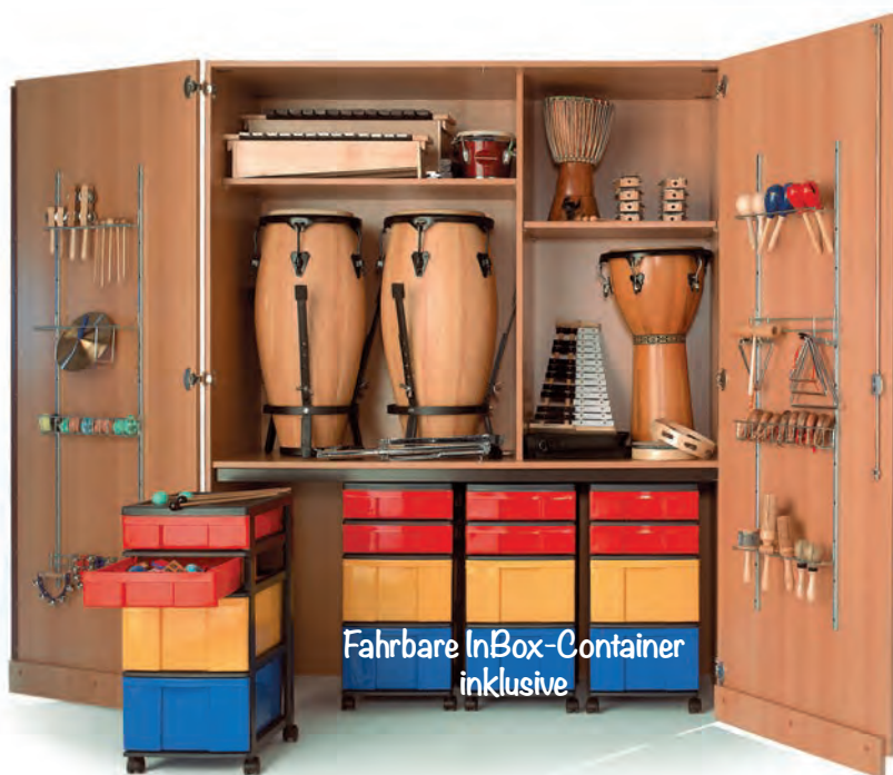
Fahrbare InBox-Container inklusive

Musikinstrumente bitte separat bestellen – siehe S. 293-294